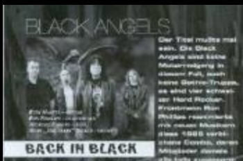
BACK IN BLACK

Der Titel musste mal sein. Die Black Angels sind keine Musikermagier in diesem Park, nicht seine Götter/Trojaner, es sind vier schwarze Hard-Rock-Professionisten. Man muss ihnen Respekt machen, nicht nur wegen ihrer 17-jährigen Karriere, sondern auch wegen ihrer 17-jährigen Leidenschaft für die Musik. Das ist das, was sie ausmacht. Sie sind nicht nur Musiker, sondern auch Menschen, die ihre Leidenschaft für die Musik in alles stecken, was sie tun. Sie sind die Black Angels, die die Musik lieben und die Musik lieben lassen.