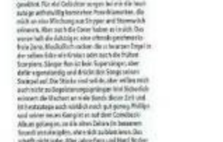
THE LAST DECEMBER

Die Black Angels sind ein Band aus der Schweiz, die im März 1991 gegründet wurde. Sie sind heute ein der bekanntesten Bands in der Schweiz und haben sich international einen Namen gemacht. Ihre Musik ist eine Mischung aus Heavy Metal, Hard Rock und Blues. Sie sind eine Band, die die Musik lieben und die Musik lieben lassen.